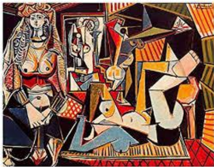
Les Femmes d'Alger (d'après Delacroix) Picasso (1955)

La démarche d'aller puiser dans le passé l'inspiration pour y trouver choses nouvelles ou à venir, de transformer ce qui a été pour concevoir d'autres formes, aussi improbables soient-elles, ne date pas d'aujourd'hui mais est toujours d'actualité quand il s'agit de bousculer les lignes et les habitudes.